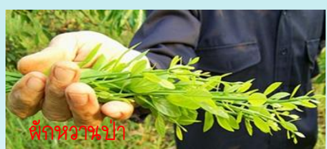
ผักหวานป่า