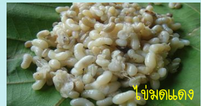
ไข่แมดแดง