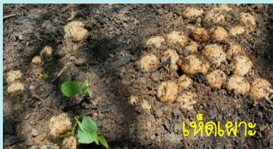
เห็ดเพาะ