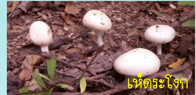
เห็ดระโงก