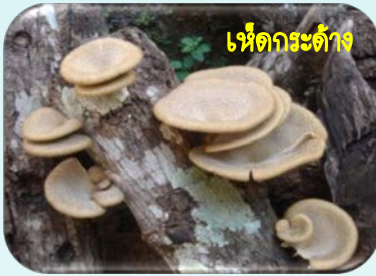
เห็ดกระด้าง