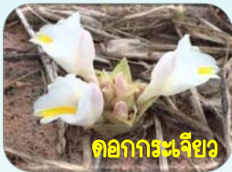
ดอกกระเจียว