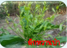
ผักหวานป่า