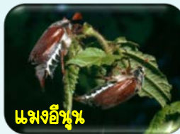
แมงอีซุง