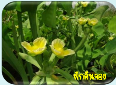
ผักค้ำจอง