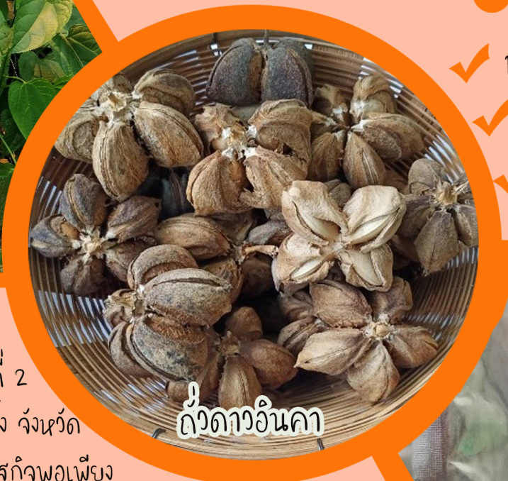
ถั่วดาวอินคา