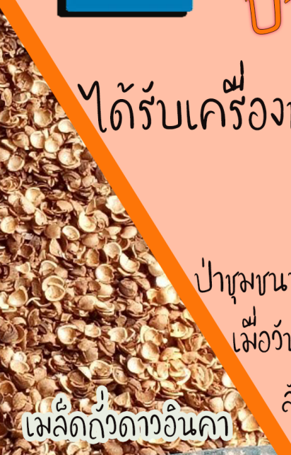
เมล็ดถั่วดาวอินคา

ป่าชุมชนบ้านท่ามะขามมีขนาดพื้นที่ 6,044-100 ไร่ ได้รับการอนุมัติจากกรมป่าไม้ เมื่อวันที่ 18 ธันวาคม 2557 ตั้งอยู่ในพื้นที่ป่าสงวนแห่งชาติ ป่าฝั่งซ้ายแม่น้ำภาชี ลักษณะเป็นภูเขา ดินเป็นดินร่วน และดินร่วนปนทราย ป่าเป็นป่าเบญจพรรณ และป่าเต็งรัง มีต้นไม้ขึ้นปกคลุมค่อนข้างแน่นหนา พันธุ์ไม้เด่น ได้แก่ มะค่าแต้ มะค่าโมง ประดู่ แดง ตะแบก ยางนา เป็นต้น