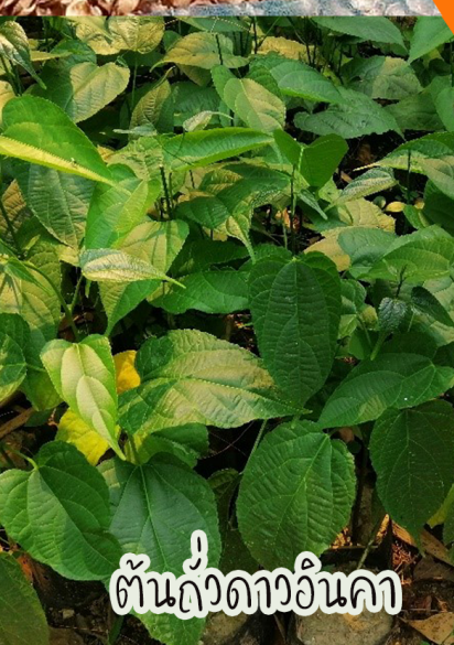
ต้นถั่วดาวอินคา