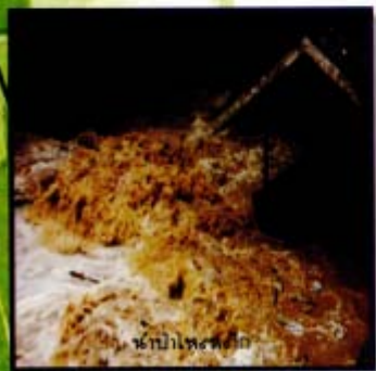
ป่าป่าเพื่อปลูก

ดินป่าที่หายไปหรือเสื่อมโทรมลง ยังหมายถึงการสูญเสียแหล่งปัจจัยในการดำรงชีวิตของประชาชนที่อาศัยอยู่รอบผืนป่านั้น ทั้งแหล่งอาหารสมุนไพร แหล่งไม้ใช้สอย ไม้ฟืน ไม้มีค่าและสัตว์ป่าหลายชนิดอาจหายไปจากผืนป่าไม่มีราคาแพงขึ้นเนื่องจากหายาก เกือบทุกอย่างที่จำเป็นต่อการดำรงชีวิตไม่สามารถหาได้จากป่าอีกต่อไป