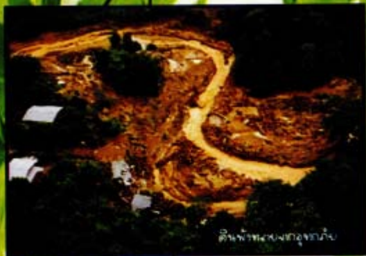
ดินฟ้าพายุฝนจากจันทบุรี

ผืนป่าที่หายไปหรือเสื่อมโทรมลง ยังหมายถึงการสูญเสียแหล่งปัจจัยในการดำรงชีวิตของประชาชนที่อาศัยอยู่รอบผืนป่านั้น ทั้งแหล่งอาหารสมุนไพร แหล่งไม้ใช้สอย ไม้ฟืน ไม้มีค่าและสัตว์ป่าหลายชนิดอาจหายไปจากผืนป่าไม่มีราคาแพงขึ้นเนื่องจากหายาก เกือบทุกอย่างที่จำเป็นต่อการดำรงชีวิตไม่สามารถหาได้จากป่าอีกต่อไป