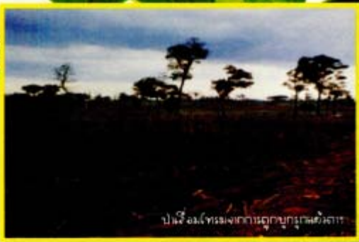
ปมเรื่อง: ไพรเมจกับการถูกบุกรุกสิ่งแวดล้อม