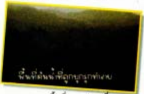
พืชที่ต้นจี่ที่อุบลราชธานี

ปัจจุบัน สภาพสังคมที่เน้นการขยายตัวทาง เศรษฐกิจ และการพัฒนาด้านวัตถุเป็นหลัก ทำให้ ผู้คนมีความจำเป็นต้องใช้จ่ายมากขึ้น การพัฒนาที่ เน้นการเพิ่มผลผลิตการเกษตรโดยการปลูกพืชเชิงเดี่ยวและการขยายพื้นที่เพาะปลูกเพื่อ เพิ่มรายได้เป็นสาเหตุสำคัญที่ทำให้พื้นที่ป่าลดลงอย่างต่อเนื่อง ประกอบกับจำนวนประชากร