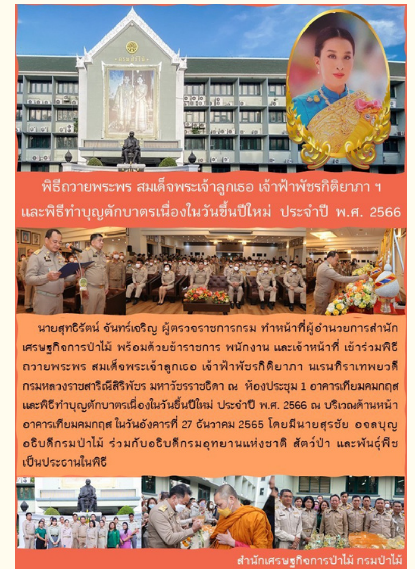
พิธีถวายพระพร สมเด็จพระเจ้าลูกเธอ เจ้าฟ้าพัชรกิติยาภา และพิธีทำบุญตักบาตรเนื่องในวันขึ้นปีใหม่ ประจำปี พ.ศ. 2566