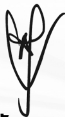
(นายสุรัชย์ อจลบุญ) อธิบดีกรมป่าไม้

มอบไว้ให้ ณ วันที่ ๒๑ กุมภาพันธ์ พุทธศักราช ๒๕๖๖