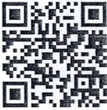
พิกัดไม้ กองที่ 1-8