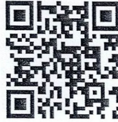
รูปไม้กองที่ 1-31