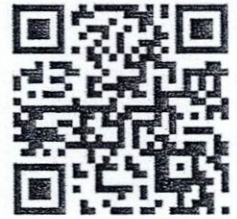
พิกัดไม้ กองที่ 30-31