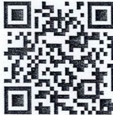
พิกัดไม้ กองที่ 9-29