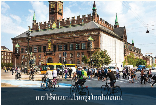
การใช้จักรยานในกรุงโคเปนเฮเกน