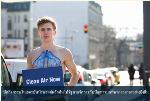
นักกิจกรรมในเยอรมันเรียกร้องคัดค้านให้รัฐบาลจัดการกับปัญหามลพิษทางอากาศอย่างยั่งยืน

หลายเมืองใหญ่ทั่วโลก แสดงให้เห็นถึงความตั้งใจในการจัดการ กับปัญหามลพิษทางอากาศในระยะยาว การส่งเสริมการใช้ขนส่งสาธารณะ สนับสนุนการใช้จักรยาน แทนการใช้รถยนต์ส่วนตัว แล้วคุณอยากเห็น ประเทศไทยมีการจัดการกับปัญหานี้ในระยะยาวอย่างไร? การจัดการที่ ทำได้มากกว่าแค่การฉีดพ่นน้ำตามถนนหรือนโยบายการจัดการมลพิษ ทางอากาศอย่างยั่งยืน