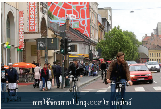
การใช้จักรยานในกรุงออสโล นอร์เวย์