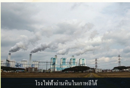
โรงไฟฟ้าถ่านหินในเกาหลีใต้

“ก่อนที่โลกจะเปลี่ยนแปลงไปมากกว่านี้ คุณล่ะเปลี่ยนแปลงตัวเองเพื่อโลกบ้างหรือยัง”