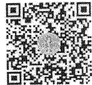
แบบสำรวจความคิดเห็น