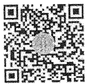
รายงานประจำปี ๒๕๖๘ สำนักงานปลัด ทส.

นักวิเคราะห์นโยบายและแผนชำนาญการพิเศษ รักษาราชการแทนผู้อำนวยการสำนักแผนงานและสารสนเทศ